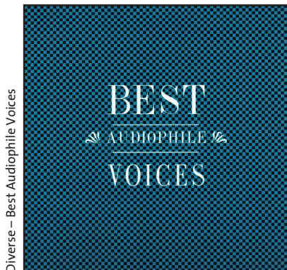
Diverse – Best Audiophile Voices