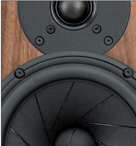
Kuschelig: Der Tiefmitteltöner rückt maximal nah an den Tweeter, um dem Ideal Punktschallquelle so nah wie möglich zu kommen